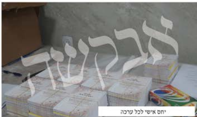
יחס אישי לכל ערכה

משפט אחד קצר וקולע יכול להשפיע רבות בחיי היומיום ובשגרה האפורה. ישנם כאלו שמזמינים את פנינת החיזוק כדי לתלות אותו בביתם. רבינו הקדוש הרי הוהיר שנעשה את נשותינו חסידות. לרבים מדובר בעבודה קשה שבמקדש. צריך לשם כך לחפש ולמצוא דיבורים מתאימים ומחברים. אבל בפנינת החיזוק יש את כל זה. הדיבורים מוגשים בצורה נעימה ומיוחדת. מי שקורא את זה בקביעות נכנסים בו המתיקות והאור שיש בספרי רבינו. שמענו גם על ישיבה חזקה מאוד, בה אחד הבחורים תולה בה מדי יום את פנינת החיזוק. בישיבה זו באמת היה גל מקורבים גדול. כנראה שלכרטיסים אלו היה חלק בזה. כמו כן התוודענו על סמינר לבנות שגם בו תלויים כרטיסי פנינת החיזוק, ומשפיע רבות.