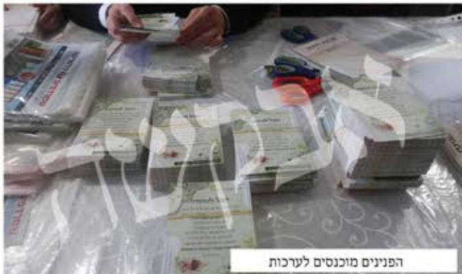
הפנינים מוכנסים לערכות