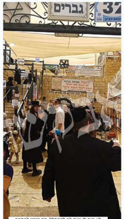
לא היה לי שום לב להתפלל. הר מירון למחרת האסון הכבד בל"ג בעומר

דומה שהנקודה המשותפת לשלושת התשובות היא כי לפעמים בעומק הצרה, העצה היעוצה היא דווקא להמשיך בחיים כרגיל ולא לבוסס בצרה עצמה. אם כי להשתדל בכל זאת לקבוע