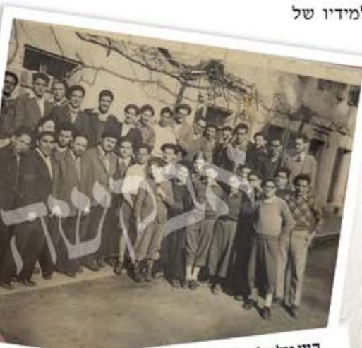
הווי גולה למקום תורה. תמונת מחזור של בני הישיבה באקס-לה-בן