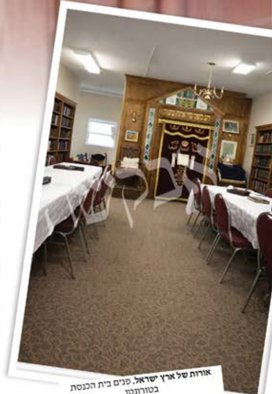
אורות של ארץ ישראל, פנים בית הכנסת בטורונטו