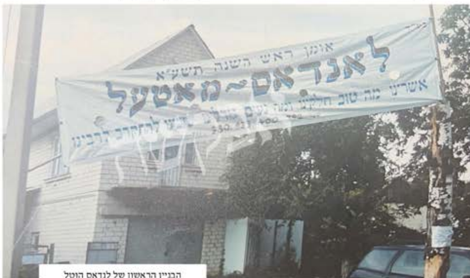
הבניין הראשון של לנדא הוטל