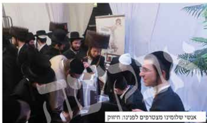
אנשי שלמינו מצטרפים לפנינת חיזוק