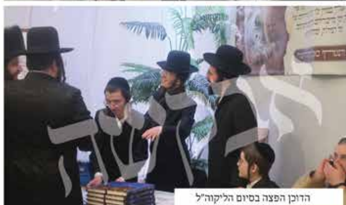
הדוכן הפצה בסיום הליקוה"ל