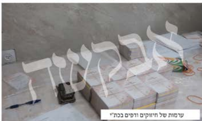
ערמות של חיזוקים ודפים בכת"י