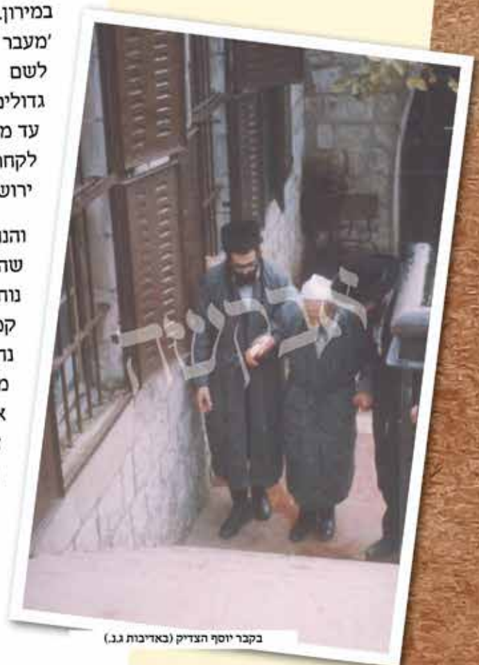
בקבר יוסף הצדיק