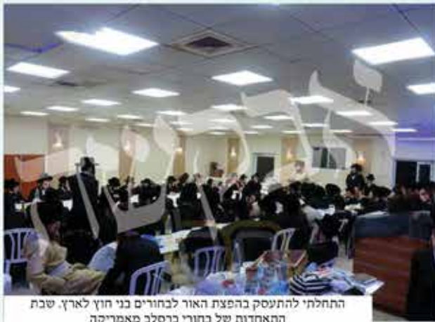
התחלתי להתעסק בהפצת האור לבחורים בני חוץ לארץ. שבת התאחדות של בחורי כרסלב מאמריקה

כדומה, אבל זה לא באמת מנחם. כאשר מישהו אמר לי שהוא לא מסוגל להבין את הכאב שלי, זה היה לפעמים הנחמה הכי טובה. כי אדם שאומר לך אמירה כזו, מצד אחד הוא משתתף בצער, ומצד שני לא דורך על שום יבלת בניסיון לחזק...".