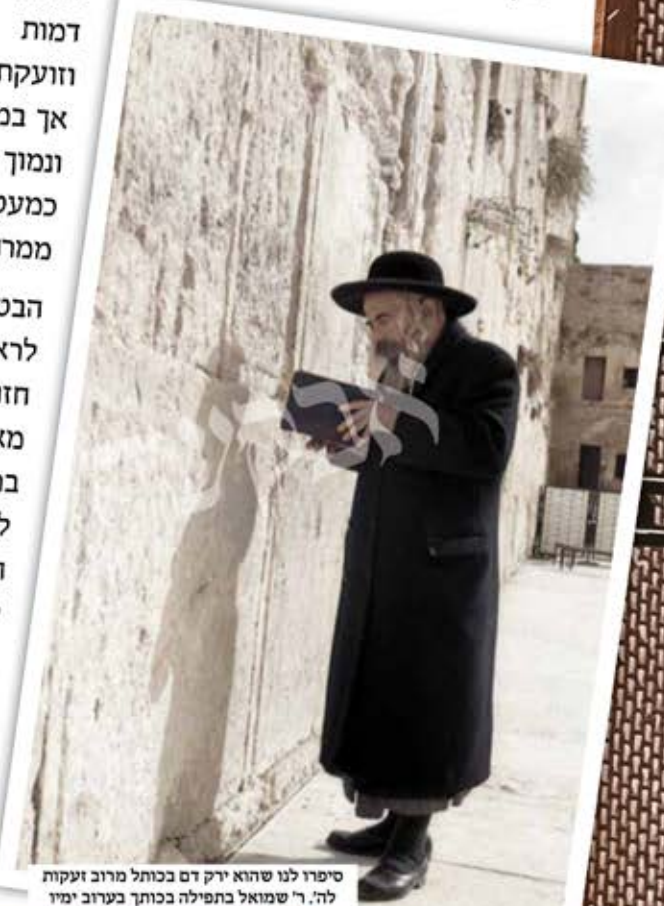
סיפרו לנו שהוא ירק דם בכותל מרוב זעקות לה. ר' שמואל כתפילה בכותך בערוב ימיו

אחרי שנים של עבודה, להבות האש הפכו לגחלים לוחשות שמראיהן אינו מסגיר את האש שטמונה בהן, אך מי שהשכיל להבחין בכך, זכה לקבל 'כווייה הגונה' שהבעירה את הלב מחדש.